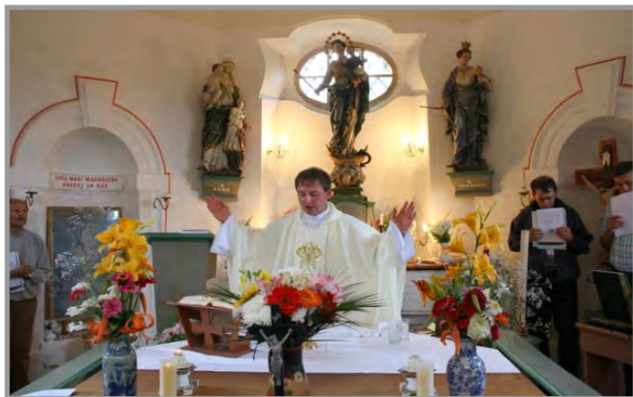
Poutní mše svatá v Dobré Vodě