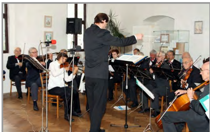
Koncert Pražského salonního orchestru na zámku