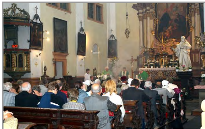
Mše svatá v kostele sv. Ignáce