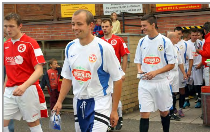
Setkání s Březnicí u Zlína na stadionu v Březnici