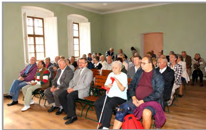
Setkání rodáků a přátel města