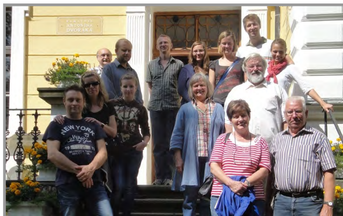
Návštěva komorního sboru z Lindow