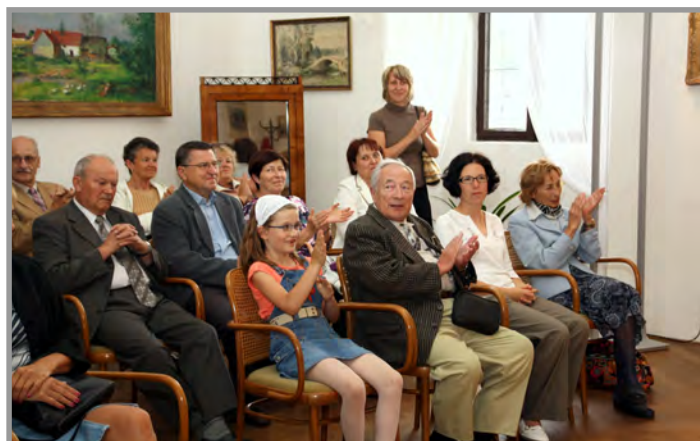
Vernisáž k výstavě Emila Freie