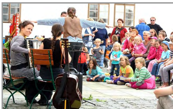
Konvent plný loutek - divadlo, řemesla, muzika