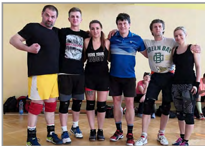
Tým Březnice - 7. místo

Komise RM pro mládež, tělovýchovu a sport pod záštitou města Březnice ve spolupráci s místními organizacemi pořádají