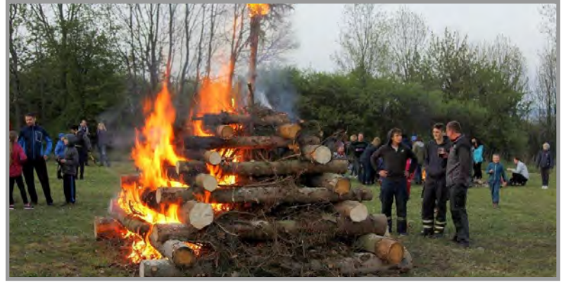
Tradiční pálení čarodějnic na Stráži – 30. dubna 2019