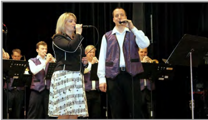
Májový koncert V ORIGINAL v kulturním domě – 1. května 2019