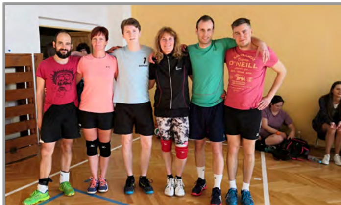
Tým Ruce v Kapce - 2. místo na turnaji Březnická desítka