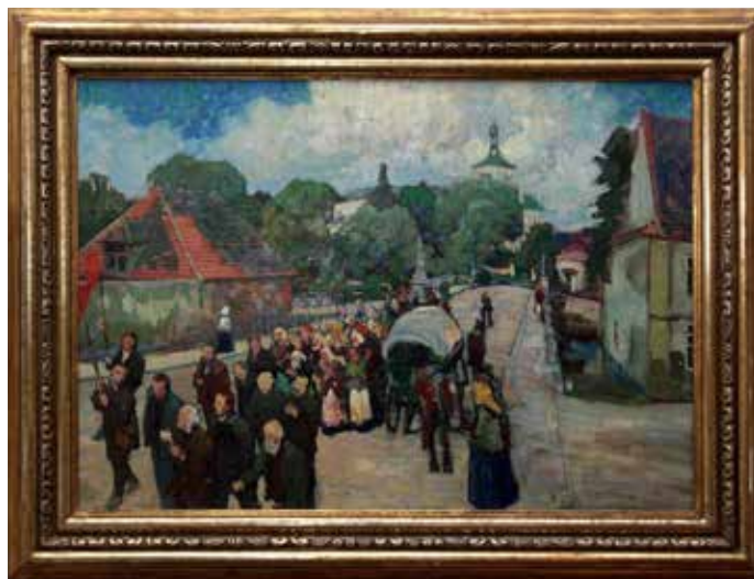
Ludvík Kuba, Svatohorské procesí, 1906, olej na plátně Obraz je umístěn ve stálé expozici v Galerii L. Kuby.