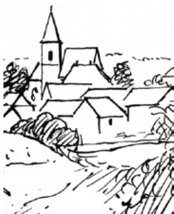
Výřez kresby Aloise Moravce z roku 1937

Odjezd ve 13:30 hod. z ulice Dolní Valy.