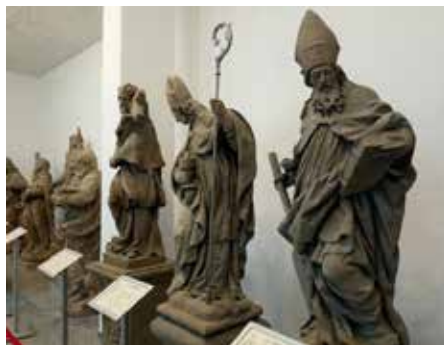
Pohled do lapidária

Sochaře a řezbáře Ignáce Hammera povolal koncem roku 1736 do Čimelic tehdejší majitel