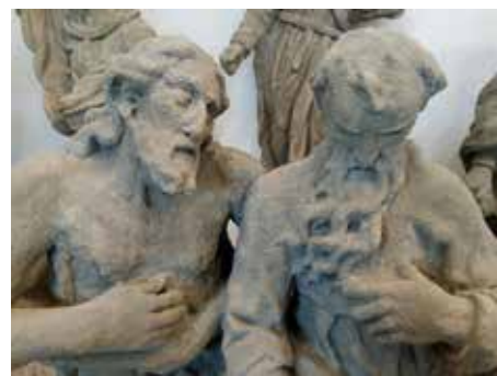
Sousoší Bůh Otec s Ježíšem

Ohrožené originály byly uloženy, opraveny a umístěny v právě otevřeném lapidáriu. Na jejich místo v původním prostředí jsou dány duplikáty. Lapidárium obsahuje zhruba tři desítky soch zobrazujících převážně postavy svatých či výjevy s církevními tématy. Ojedinelé je zejména sousoší Bůh Otec s Ježíšem.