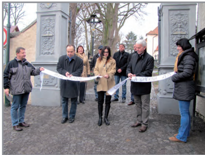
Na konci roku 2015 byla dokončena realizace chodníků a opravy zdi na hřbitově. 18. prosince byla slavnostně přestřižena páska za přítomnosti vedení města, zhotovitele a zástupce Středočeského kraje.

a následným položením jedné nebo dvou vrstev asfaltocementové směsi. Pro nás zůstává největším úkolem tohoto roku dokončit započatou II. etapu revitalizace centrální části města a zkoordinovat ji právě s touto stavbou.