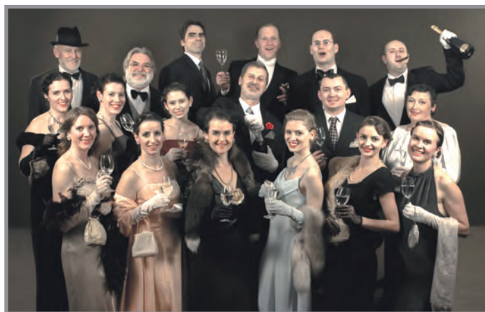
Členové spolku Orel Kasejovice

Dovolujeme si vás touto cestou pozvat na Společenský ples , který pro širokou veřejnost připravil odbor kultury Města Březnice společně s kapelou 5 o'clock coffee. V jejich podání uslyšíte známé melodie v rytmu waltzu, tanga, swingu, rock'n'rollu, latiny, lidových písní, polky a valčíku. O doprovodný program se postará spolek Orel Kasejovice. Uvidíte Retro módní přehlídku ze 30. let minulého století, budete moci obdivovat krásné dámy i elegantní pány. Přehlídka je proložena krátkými scénkami, které dotvářejí dobovou atmosféru a vnášejí lehký humor do celého dne. V průběhu celého večera můžete ochutnat čisté přírodní víno z Jeviněvského vinařství z oblasti Mělnicka. Pěstování vinné révy má v obci Jeviněves dlouholetou tradici. První zmínka pochází již z roku 1295. Mimo jiné se na těchto vinicích točí oblíbený seriál Vinaři.