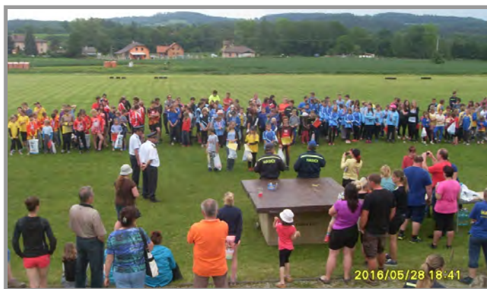
Závěr hry Plamen Petrovice