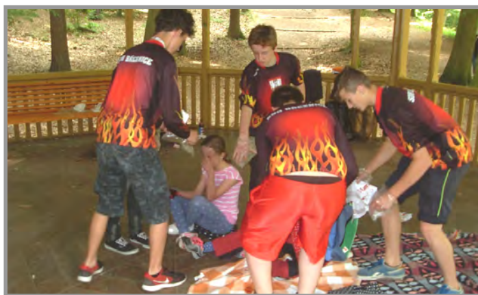
Krajské kolo v první pomoci Mladá Boleslav