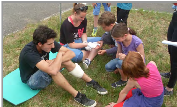
Okresní kolo v první pomoci Příbram

Dne 21. 5. 2016 od 13 hodin pořádal okrsek č. 8 soutěž v požárním útoku. Počasí přálo a soutěž proběhla v přátelském duchu. Chceme tímto poděkovat každému, kdo nám pomohl s organizací chodu soutěže, samotným soutěžícím za skvělé sportovní výkony a v neposlední řadě i fanouškovským základnám jednotlivých soutěžních týmů.