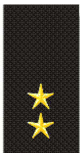
Velitel směny Ved. vnitřního oddělení Ved. přestupkového oddělení