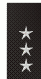
U MP odpracováno 6 roků