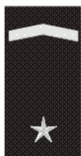
U MP odpracováno 9 roků