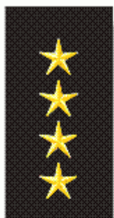
Ředitel Městské policie