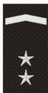
U MP odpracováno 12 roků