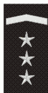
U MP odpracováno 15 roků