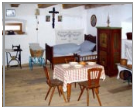
Interiér špýcharu v Prostřední Lhotě.