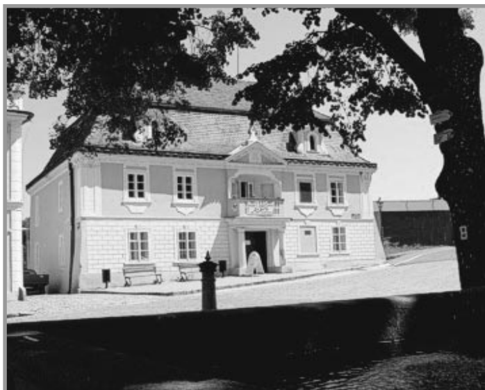
Muzeum Nový Knín

V okolí Nového Knína jsou pro turisty k dispozici i tři trasy naučných stezek s geologicko -hornickou tematikou.