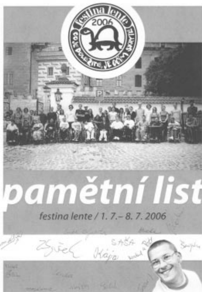
listina, kterou jsme obdrželi za spolupráci s „Festina Lente“ - latinský název akce znamená „Spěchej pomalu“.