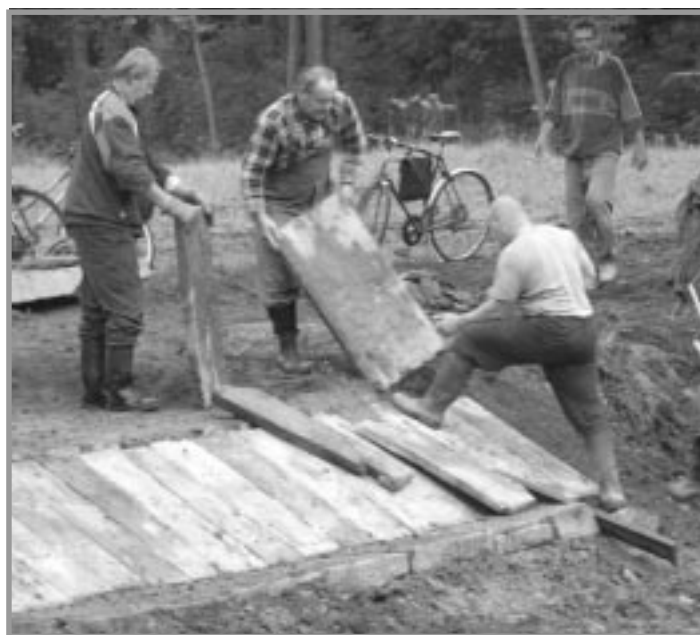
Na nově vytvořeném přelivu pracují členové spolku