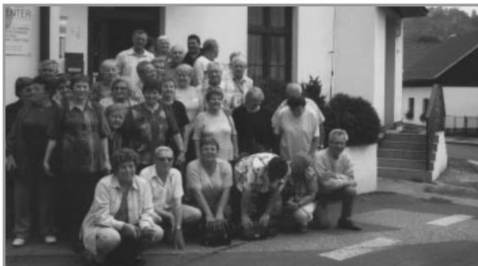
Fotografie z Městské knihovny a Infocentra – výstava k 50. výročí založení ZO SPCCH