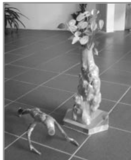
Foto z výstavy samorostů

Putování za skřítkem Dubínkem aneb již tradiční lampionový průvod