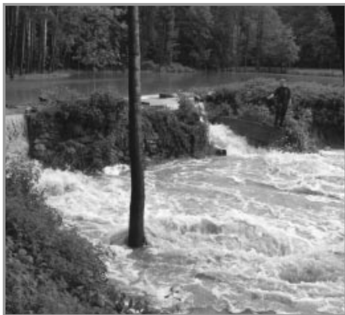
Povodeň na rybníku „Džbánek“ 29.5.2006